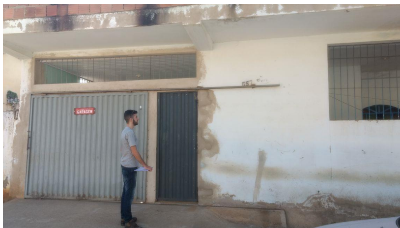
Figura 1. Registro fotográfico da visita.

No dia 08/06/2017, equipe técnica da empresa Synergia, enviou SMS para os números declarados pelo manifestante, com o objetivo que a família entre em contato com a empresa para realização do Cadastro Integrado.